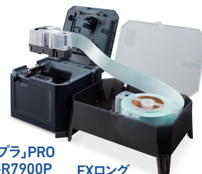
「テプラ」PRO SR-R7900P + EXロング テープカートリッジ

右の写真は「テプラ」(SR-R7900P)の本体です。さらにその右側は本体ではなく、外付けの長尺カートリッジ。この存在を知ったことが突破口になりました。作業分担を可能にする複数台購入が容易なうえ、「約1時間は目を離して別の作業に集中できる」ことが採用の決め手でした。