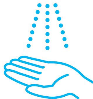
手洗い・消毒の徹底