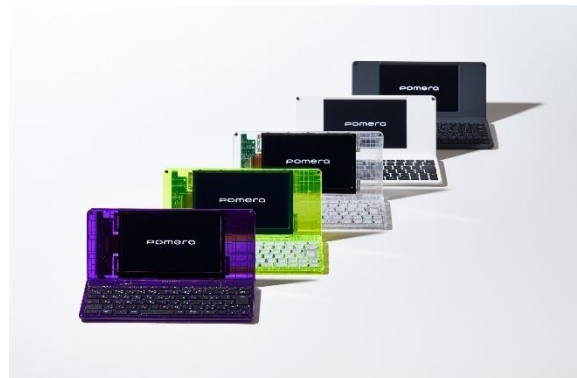
DM250 XYZ Midnight Purple（手前）と現行モデル（奥）過去の限定色（中）