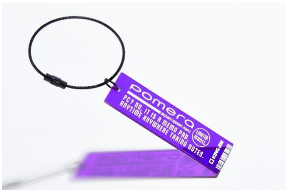
同梱品：限定アクリルキーホルダー（ロゴタグ）