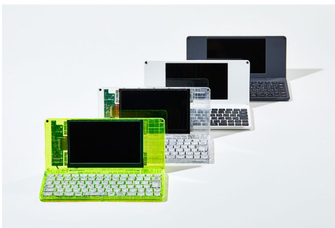
DM250XY Crystal Neon Yellow と過去の限定ポメラ