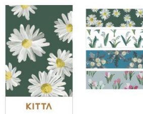
フラワー 9 (KIT074)