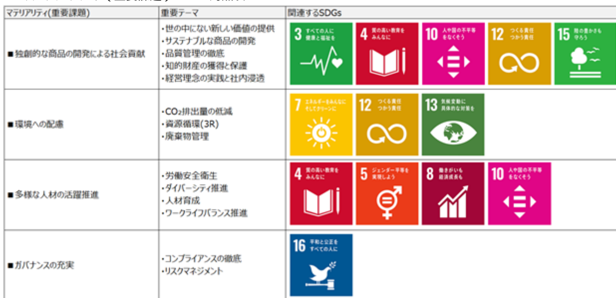
マテリアリティ（重要課題）・SDGs対照表

サステナビリティの向上を推進するにあたり、「キングジムグループ サステナビリティ基本方針」を定めております。基本方針に沿って、ESGの観点から当社の事業活動と社会課題の関連性が高い項目をマテリアリティ(重要課題)として特定し、これらに紐づく重要テーマを選定いたしました。特定したマテリアリティ(重要課題)をSDGsと関連付け、マテリアリティ(重要課題)の解決に向けた取り組みを通してSDGsの達成に貢献してまいります。